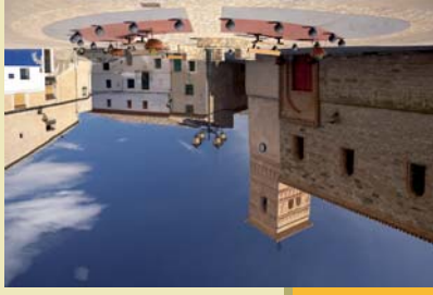
Plaza. Iglesia y torre mudéjar