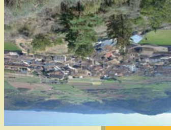
Casteljón de Valdejasa

menos redondeadas y delimitadas por "vales" o valles de fondo plano. Estos fondos de valle, formados por material suelto procedente de los escarpes y laderas, están ocupados por campos de cultivo dedicados principalmente al cereal de secano. En las laderas de estas estructuras, allí donde es posible, crecen algunas especies de porte arbustivo como enebros, romero, tomillo, carrascas, etc. En alturas superiores y sobre las plataformas terciarias se desarrolla un denso pinar de pino carrasco ( Pinus halepensis ). No es extraño,