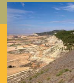
Vista desde el Santuario de Santa Ana