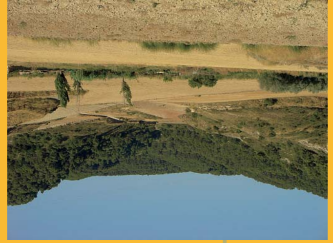
Inleto de Val de Cantales

menos redondeadas y delimitadas por "vales" o valles de fondo plano. Estos fondos de valle, formados por material suelto procedente de los escarpes y laderas, están ocupados por campos de cultivo dedicados principalmente al cereal de secano. En las laderas de estas estructuras, allí donde es posible, crecen algunas especies de porte arbustivo como enebros, romero, tomillo, carrascas, etc. En alturas superiores y sobre las plataformas terciarias se desarrolla un denso pinar de pino carrasco ( Pinus halepensis ). No es extraño,