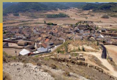
Castejón de Valdejasa